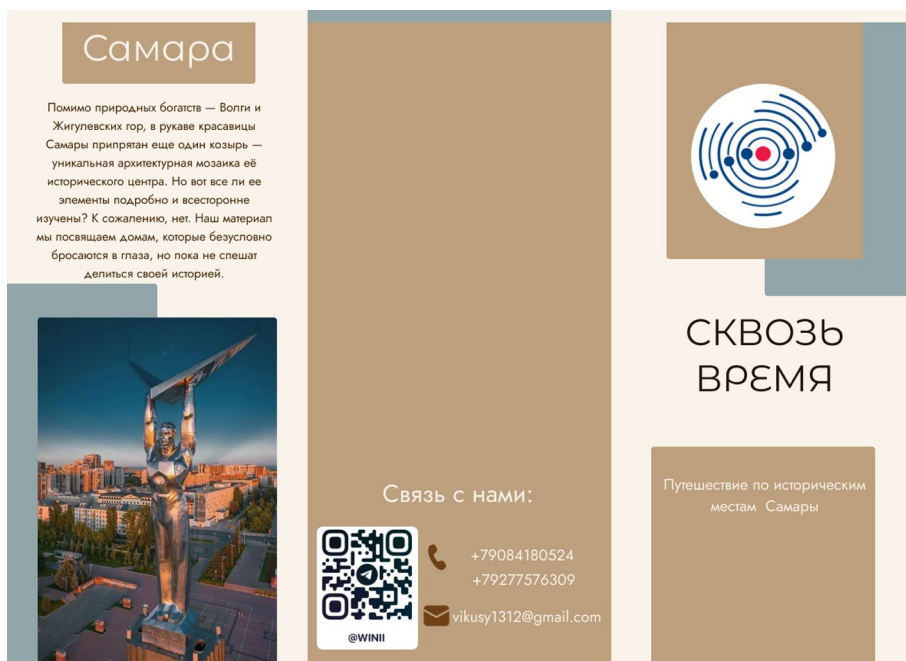
Рис. 2. Лицевая сторона разработанного туристического буклета

с описанием состоит из информации, включающей в себя краткую историю домов и фотографии к ним. Страницы большого разворота с картой состоят из туристического маршрута с информацией о времени и расстоянии, указанием домов на карте (рис. 1).